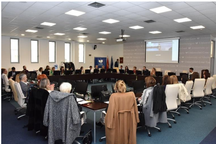
Подгорица / Podgorica / 13.03.2023.

социјални рад и на Ветеринарском факултету Универзитета у Љубљани. Додатно су учесницима представљене организације алумниста на Универзитету у Болоњи и Аутономном универзитету у Мадриду, као и могућности за развој и увођење електронских платформи за повезивање и сарадњу са алумнистима.