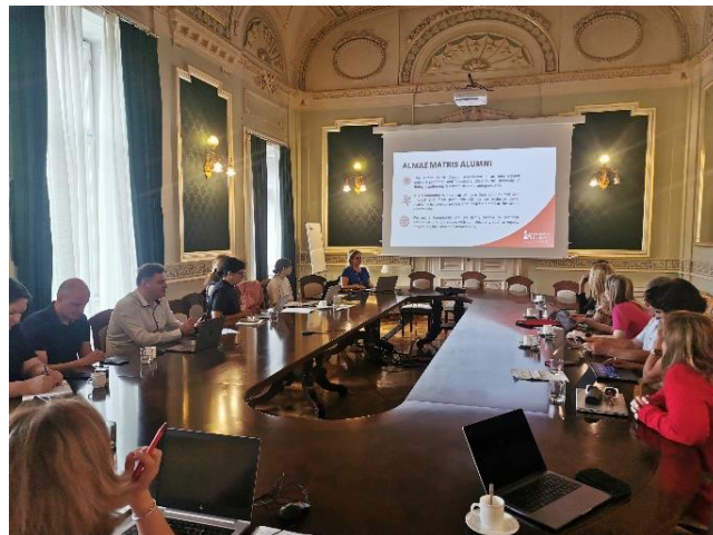
Љубљана / Ljubljana / 27.06.2023.

University of Ljubljana were presented. In addition, alumni organizations at the University of Bologna and the Autonomous University of Madrid were presented to the participants, as well as opportunities for the development and introduction of electronic platforms for connecting and collaborating with alumni.