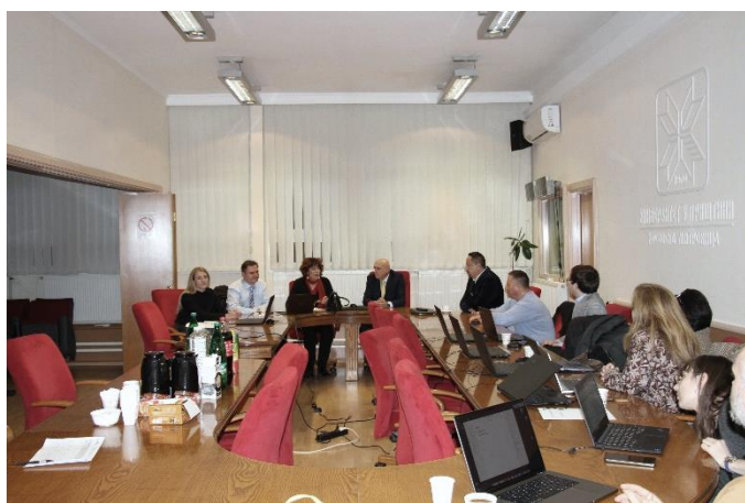
Косовска Митровица / Kosovska Mitrovica / 13.02.2024.

On March 26 and 27, 2024, the regular annual meeting of the Management Board of the AL4LIFE consortium was held at the University in Kosovska Mitrovica. The working sessions organized in the Rectorate and at the Faculty of Medicine were physically attended by representatives of the University of Montenegro, the University of Ljubljana, the University of Bologna, the Autonomous University of Madrid, as well as representatives of the University of Priština in Kosovska Mitrovica and the local Erasmus+ office. Representatives of the University of Donja Gorica and the International Business College Mitrovica joined the meeting via provided video link. The main topics of the meeting were related to progress in achieving project goals, presentation of achieved results and planning of future project activities in the field of cooperation with alumni.