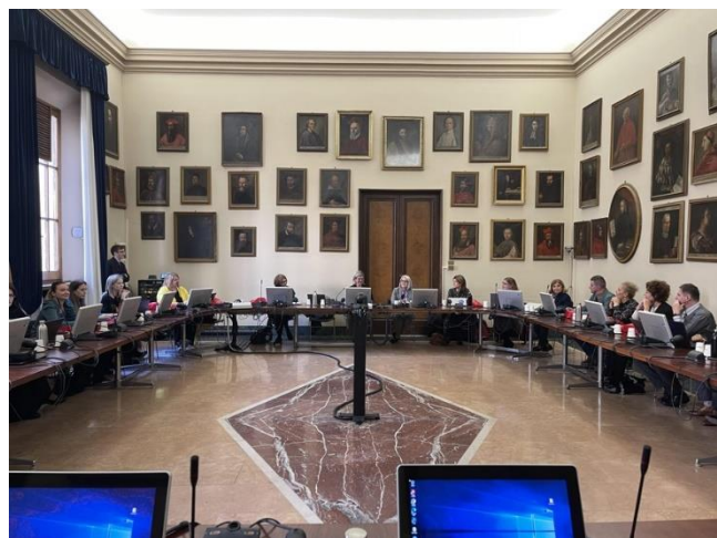
Болоња / Bologna / 09-10.11.2023.

На састанку на Универзитету у Болоњи у новембру 2023. године представљени су извештаји о актуелном статусу организација алумниста на универзитетима укљученим у пројекат, радне верзије алумни стратегија и добра европска пракса. Поред представника конзорцијума пројекта AL4LIFE, састанку у Болоњи су присуствовале и представнице Универзитета у Хелсинкију, Универзитета у Лајдену и Католичког универзитета Лувен које су поделиле своје дугогодишње искуство у развоју и раду удружења и мрежа алумниста и организацији активности алумниста.