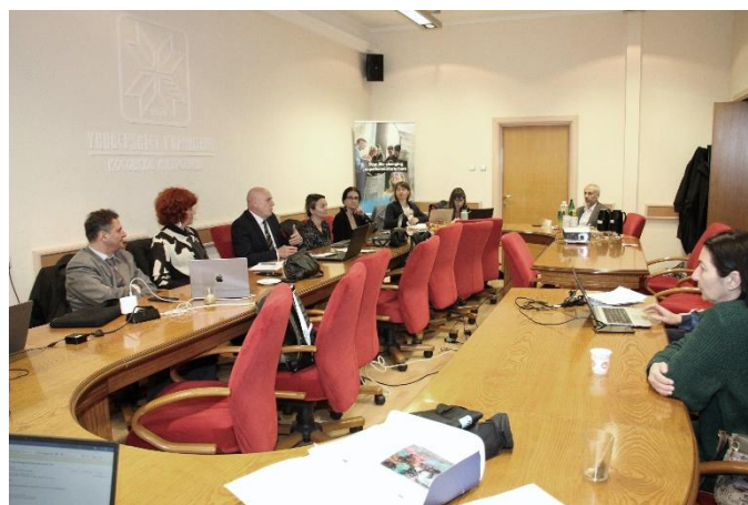
Косовска Митровица / Kosovska Mitrovica / 26.03.2024.