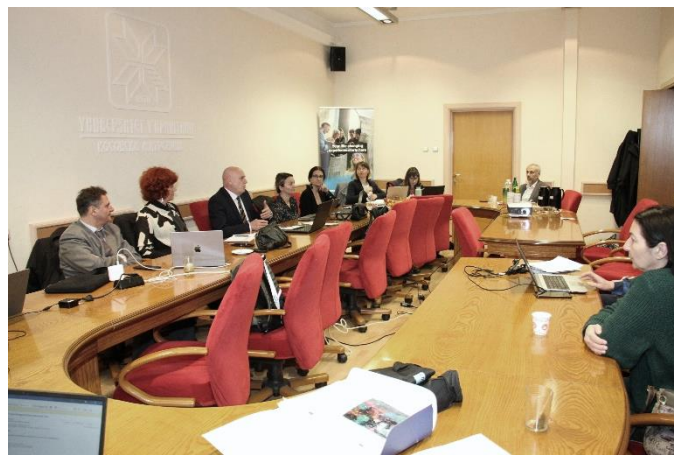
Косовска Митровица / Kosovska Mitrovica / 26.03.2024.