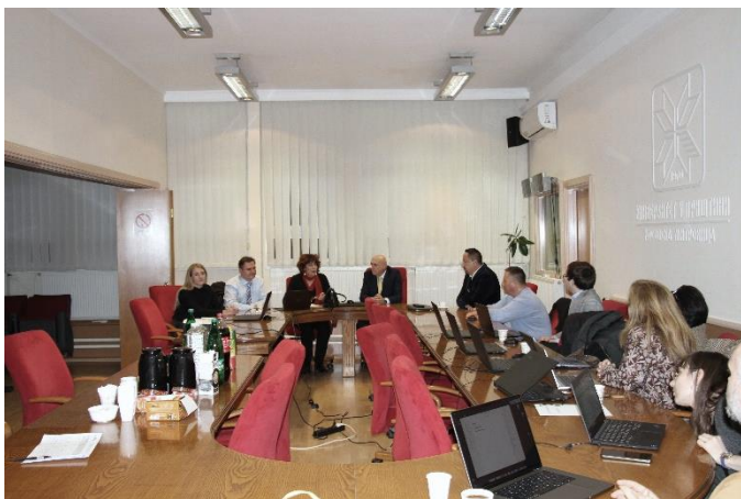
Косовска Митровица / Kosovska Mitrovica / 13.02.2024.

On March 26 and 27, 2024, the regular annual meeting of the Management Board of the AL4LIFE consortium was held at the University in Kosovska Mitrovica. The working sessions organized in the Rectorate and at the Faculty of Medicine were physically attended by representatives of the University of Montenegro, the University of Ljubljana, the University of Bologna, the Autonomous University of Madrid, as well as representatives of the University of Priština in Kosovska Mitrovica and the local Erasmus+ office. Representatives of the University of Donja Gorica and the International Business College Mitrovica joined the meeting via provided video link. The main topics of the meeting were related to progress in achieving project goals, presentation of achieved results and planning of future project activities in the field of cooperation with alumni.